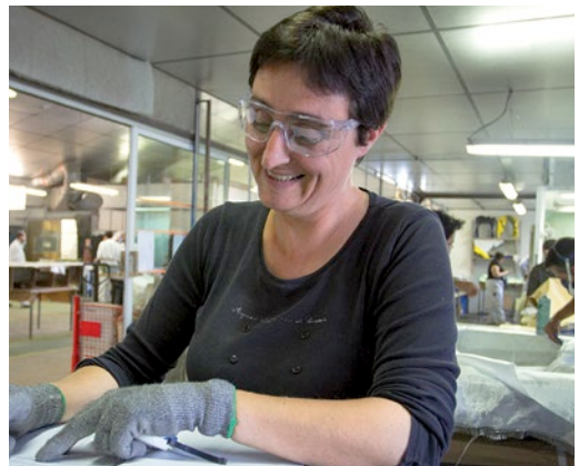
Institut de Formation Industrielle Peinture 33 à Ambarès-et-Lagrave

c'est le nombre d'heures de travail réalisées par des publics en insertion sur les marchés publics du Conseil général de la Gironde pour 280 entreprises partenaires.