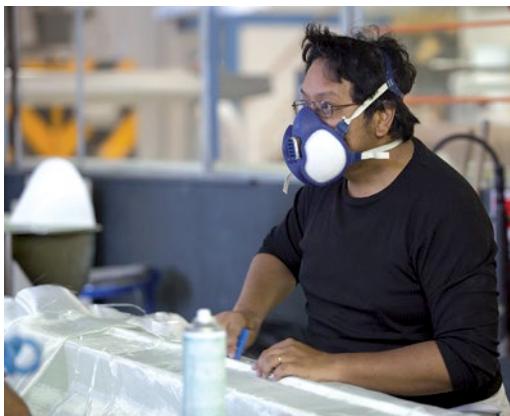
Institut de Formation Industrielle Peinture 33 à Ambarès-et-Lagrave