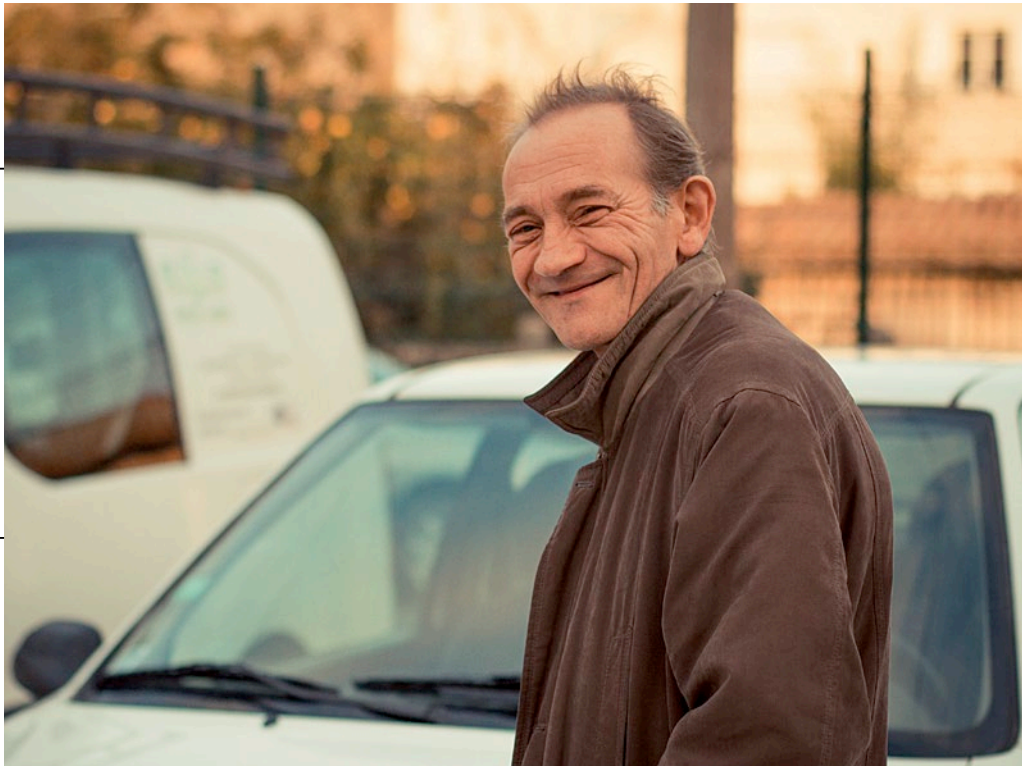
Des voitures gratuites pour des Médocains en insertion

Quand le Conseil général passe des Saxo, c'est pour la bonne cause ! L'association SOS Emplois Médoc, spécialisée dans l'Insertion par l'Activité Économique (IAE) à Lesparre, a reçu les clefs de deux Citroën, issues de la flotte départementale.